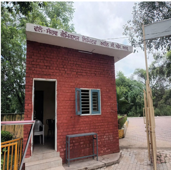
Security room, washroom along with furniture.

Dera Bassi, Punjab, India HRGX+R22, Government College Rd, Bhagat Singh Nagar, Dera Bassi, Punjab 140507, India Lat 30.577073° Long 76.847468° 14/07/23 01:23 PM GMT +05:30